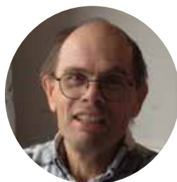
Av Sven Bernesson, SERO

inte behöver gå kontinuerligt med låg belastning. Denna lösning är vanligast vid satseldade pannor såsom halmpannor och vedpannor. Verkningsgraden blir betydligt bättre jämfört med det